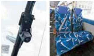
ドライブレコーダー 最前列三点式シートベルト

ドライブレコーダー、業務用無線、デジタルタコグラフ、車間距離警報装置、デーライト(LED照明)・最前列三点式シートベルト、車高ダウン装置、3枚トランクルーム