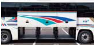
3枚トランクルーム