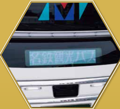
フルカラーLED表示パネル