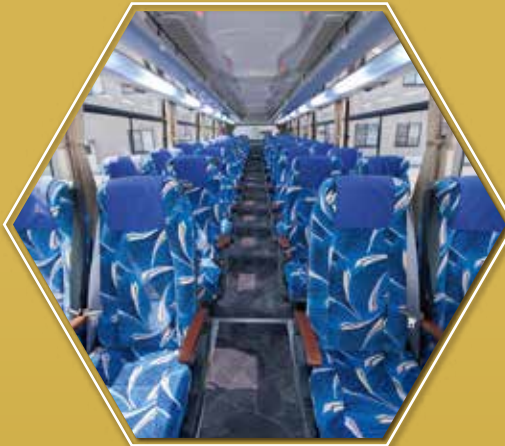
ハイグレードワイドシート

「おもてなし車両 リボン55J」50両は次のステップへ 「リボン44J」50両導入計画始動