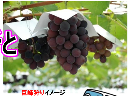
巨峰狩りイメージ