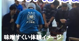
味噌すくい体験イメージ