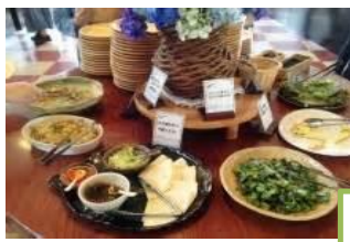
バイクンクイメージ