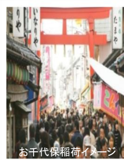
お千代保稲荷イメージ