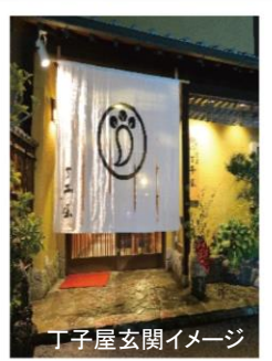
丁子屋玄関イメージ