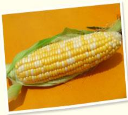
↑スイートコーン イメージ