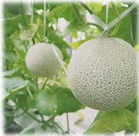
↑ メロン狩り イメージ