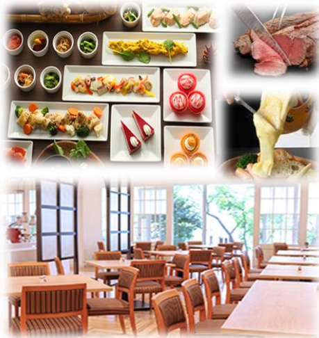
↑ ランチビュッフェ イメージ