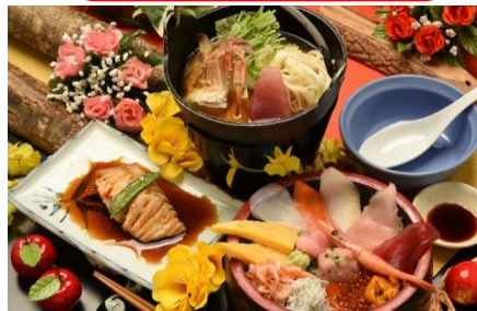
↑ 昼食 イメージ