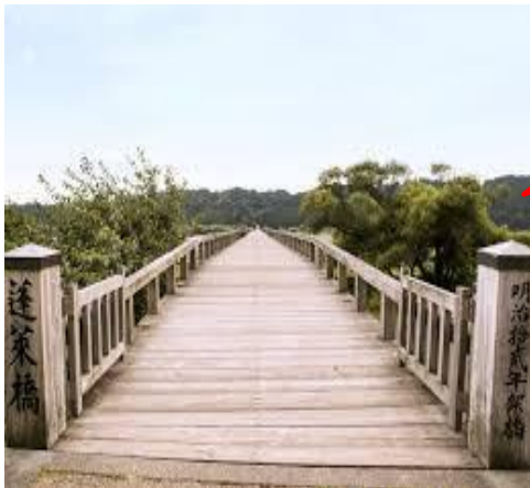
↑ 蓬莱橋 イメージ