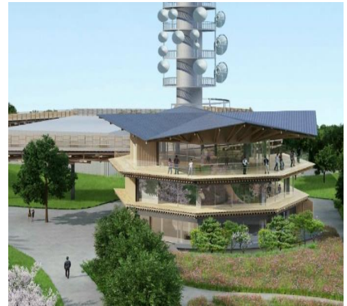
↑ 夢テラス イメージ